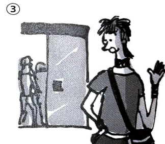
Ende, Konzert, Ausgang, suchen, bemerken, Handy, weg sein