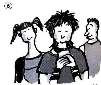
jemand, abgeben, Handy, zurückbekommen, sich freuen