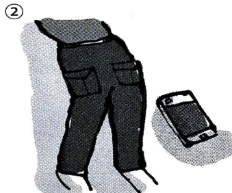
nicht merken, Handy, Hosentasche, herausfallen