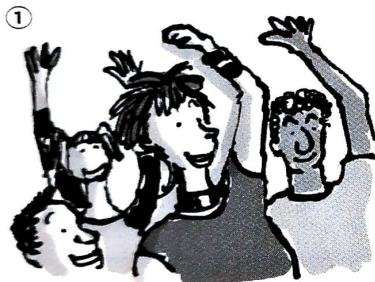
gestern, Konzert, sich freuen, Fans jubeln, wild

Sehen Sie die Bilder an und schreiben Sie mithilfe der Wörter in der 1. Person im Perfekt eine Geschichte.