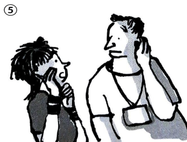
Saalordner, gehen, fragen