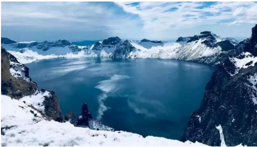
长白山 Cháng bái shān