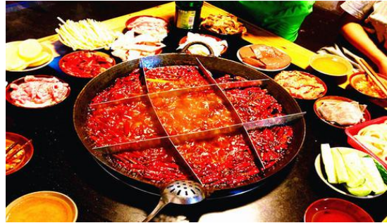
重庆火锅 Chóng qing huǒ guō