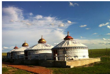
蒙古包 Méng gǔ bāo