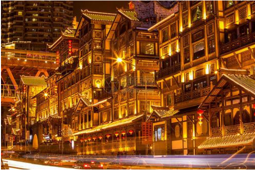
洪崖洞 Hóng yá dòng