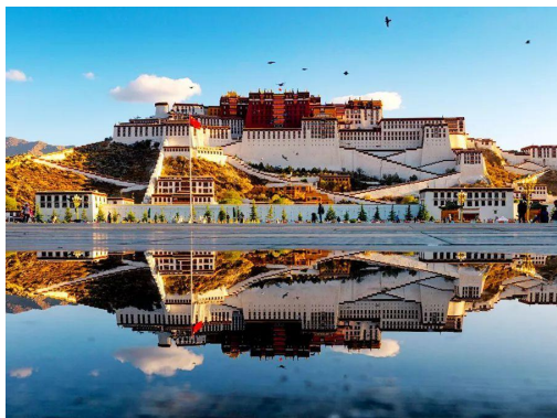
布达拉宫 Bù dá lā gōng