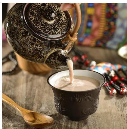
酥油茶 Sū yóu chá